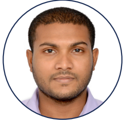
ڈاکٹر طارق حاشمی

پاکستان پیپلز پارٹی کے سابق نائب صدر اور سوشلسٹ تحریکوں کے سربراہ